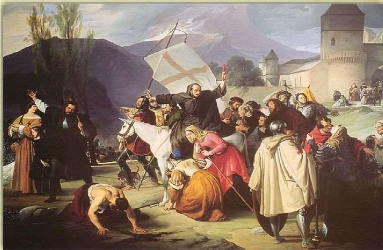
Francesco Hayez - Pietro l'Eremita predica la crociata - 1828