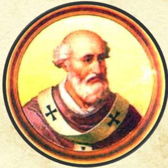
Urbano II (1088, 1099) – La prima Crociata