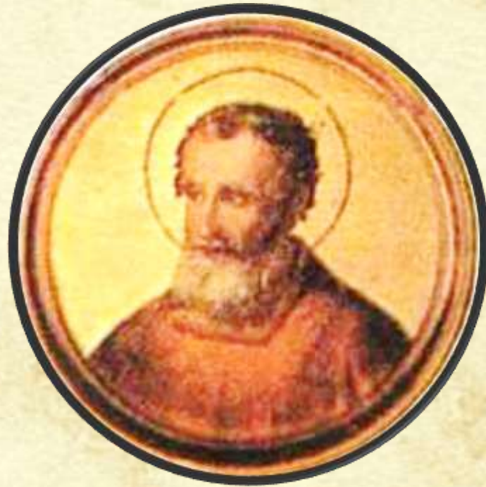
Celestino V (1294, 1294) – Fece per viltade il gran rifiuto