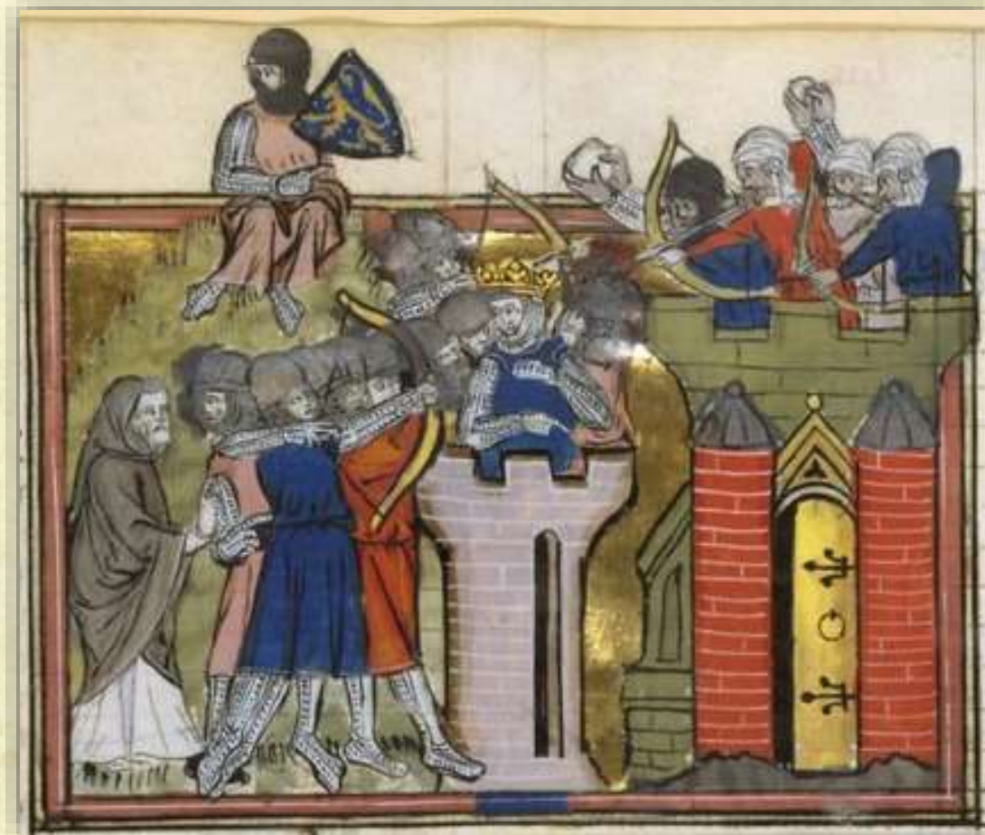
Miniatura del XIV secolo - Assedio di Gerusalemme - Goffredo di Buglione