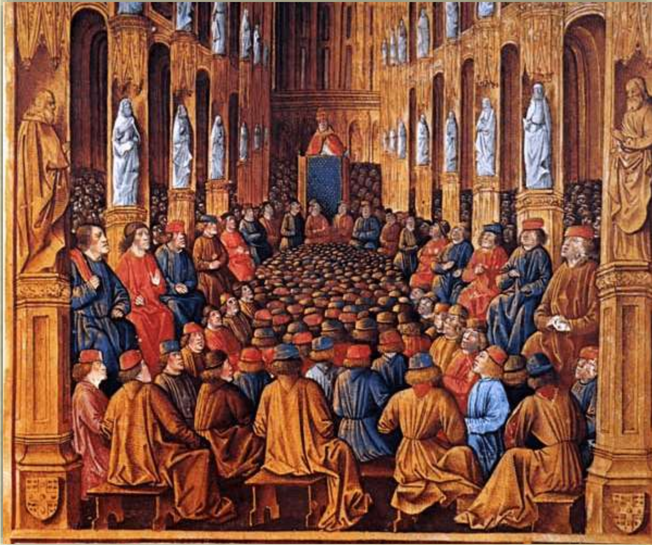
Clermont - 27 novembre 1095