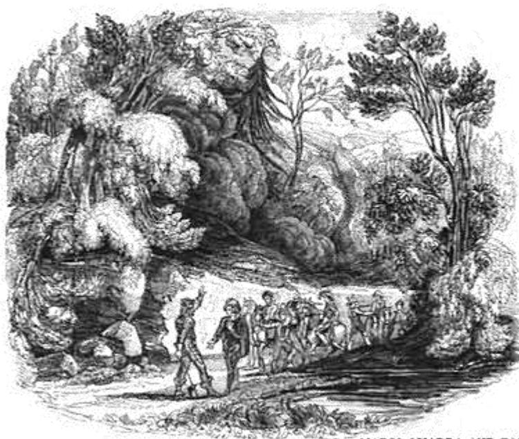
MARCO SCIARRA AND TASSO

«La foresta della Faiola, i cui enormi alberi sorgono su di un antico vulcano, fu l'ultimo teatro delle gesta di Marco Sciarra. Chiunque ci sia passato vi dirà che è il posto più bello di quella incantevole campagna romana, il cui aspetto cupo sembra fatto apposta per la tragedia. Essa cinge col suo nero fogliame le vette del monte Albano. Noi dobbiamo questa stupenda montagna ad una eruzione vulcanica [...]. Monte Cavo, che si innalza cinto dalle cupe ombre della Faiola, ne è la sommità. Si vede da ogni luogo, da Terracina e da Ostia come da Roma e da Tivoli, e l'orizzonte di Roma così conosciuto dai viaggiatori è chiuso a mezzogiorno dai colli alban, oggi traboccanti di ville.»